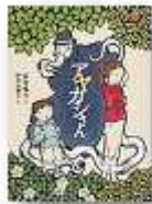
アヤカンさん 913.6/トミ 福音館書店