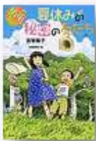
夏休みの秘密の友だち 913/トミ 偕成社