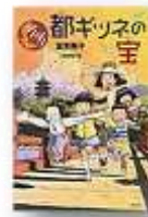
それいけ！都ギツネの宝 913.6/トミ 偕成社