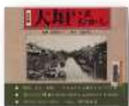
写真集 大垣いまむかし 215/ 清水春一/監修 岐阜郷土出版社

『大垣の本いろいろ①』 昔の大垣の風景は、どんなふうだったのかな？ 百年前の大垣城や大垣駅はどんな様子だったのか。そんな昔の大垣の様子が一目でわかる本が、今回、ご紹介する『写真集 大垣いまむかし』です。 『写真集 大垣いまむかし』では、大正や昭和初期の大垣の様子が、現代(出版当時の昭和六十三年)と比べてみる事ができます。戦争で焼失する前の大垣城、昭和初期の市役所、図書館などの建物、駅前通りや船町通りなどの町並みの写真が収録されています。写真集を見ながら、昔の大垣にタイムスリップしてみませんか。