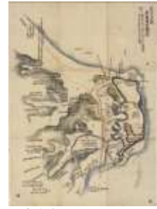
たかく 肥前国高来郡有馬浦原城攻図