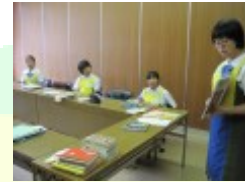
読み聞かせの練習