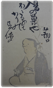
与謝蕪村筆 「宮崎荊口肖像」 (「俳仙集」より)