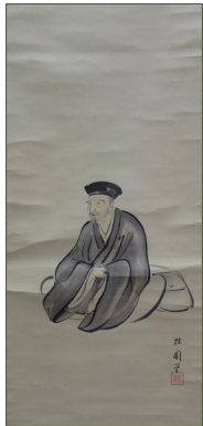
森柱園筆 芭蕉翁尊像