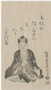
松浦菴金鷲筆芭蕉像 国枝静也編「潮の花」より