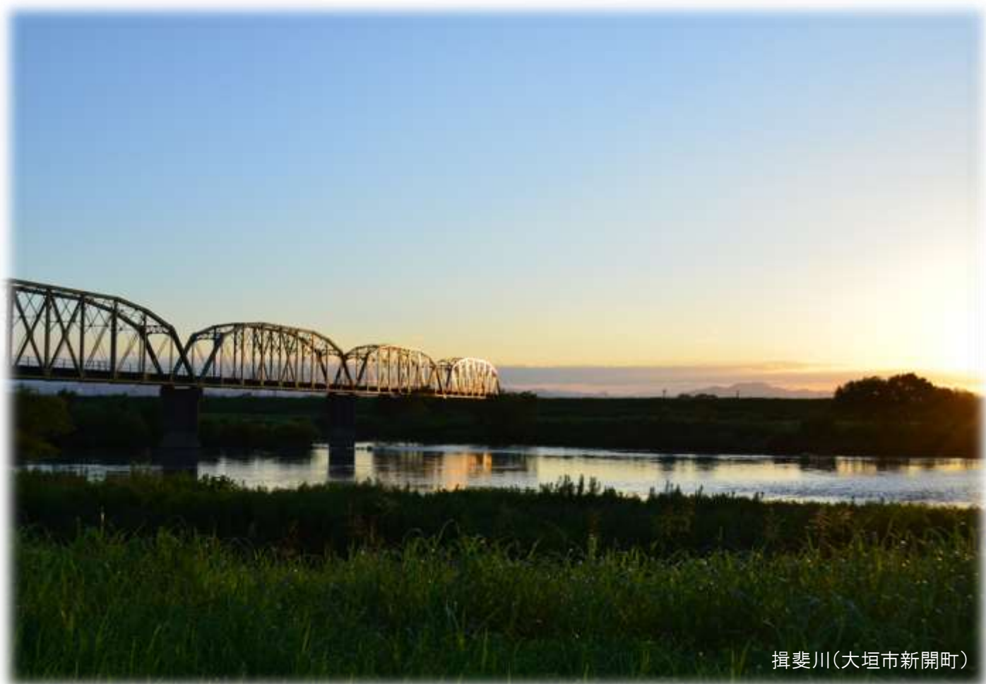
揖斐川(大垣市新開町)