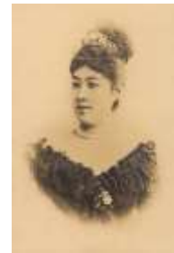
写真(ウィーン時代の極子)