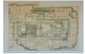
大垣旧藩城郭ノ図