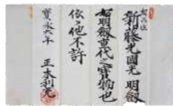
新藤光國光明劍重代之寶物之記