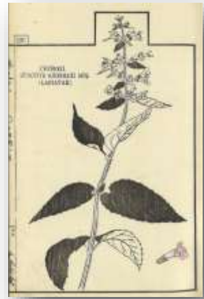
「チョロギ」の図 飯沼慾斎著『官許新訂草木圖説 草部』より