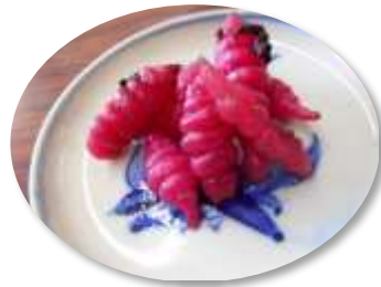
「チョロギ」って 知っていますか？

今回の展示では、食をテーマとして、江戸時代末期から大正時代の料理に関する引札や和本を展示します。