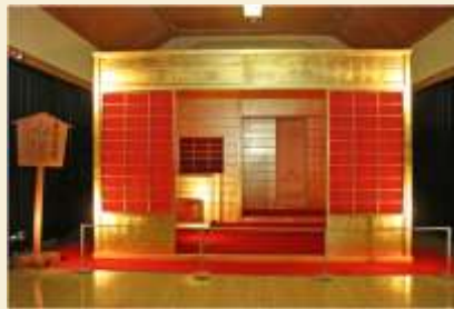
黄金の茶室(京都市蔵)