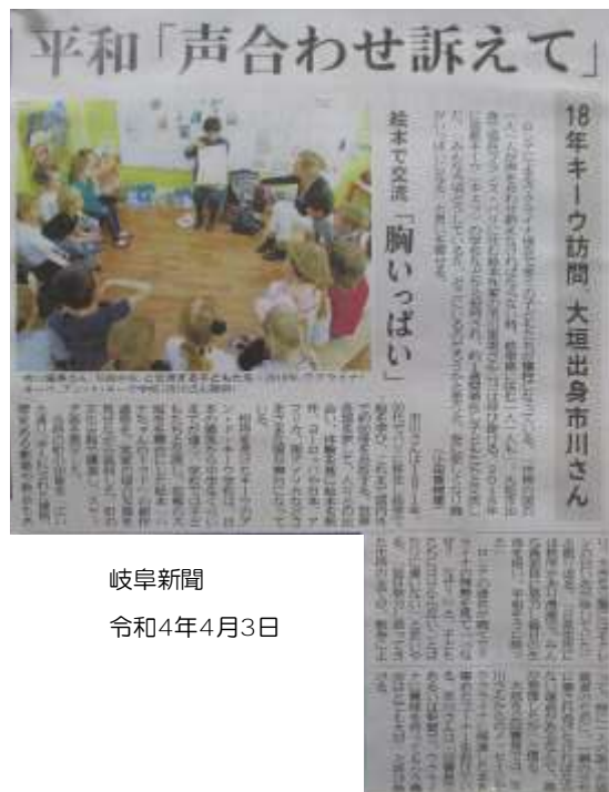
岐阜新聞 令和4年4月3日