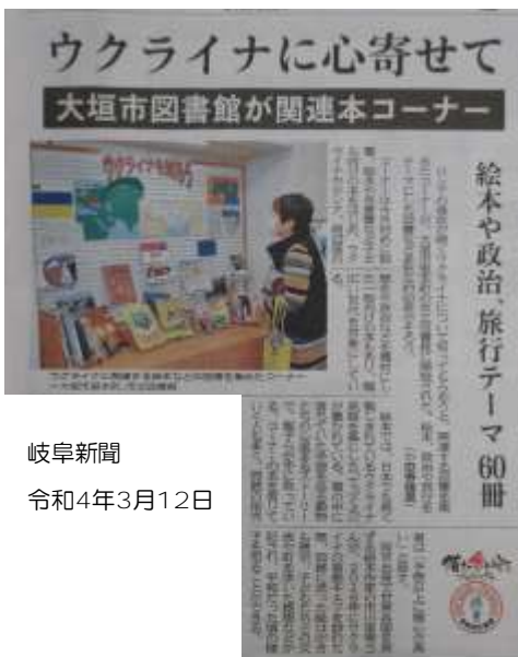
岐阜新聞 令和4年3月12日